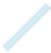
1 double décimètre (pas en fer)