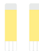
2 bâtons de colle