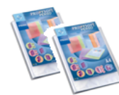
2 lutins personnalisables de 80 vues minimum